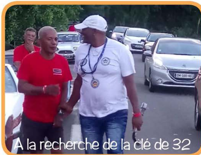
A la recherche de la clé de 32