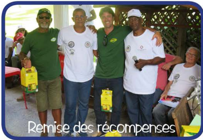
Remise des récompenses