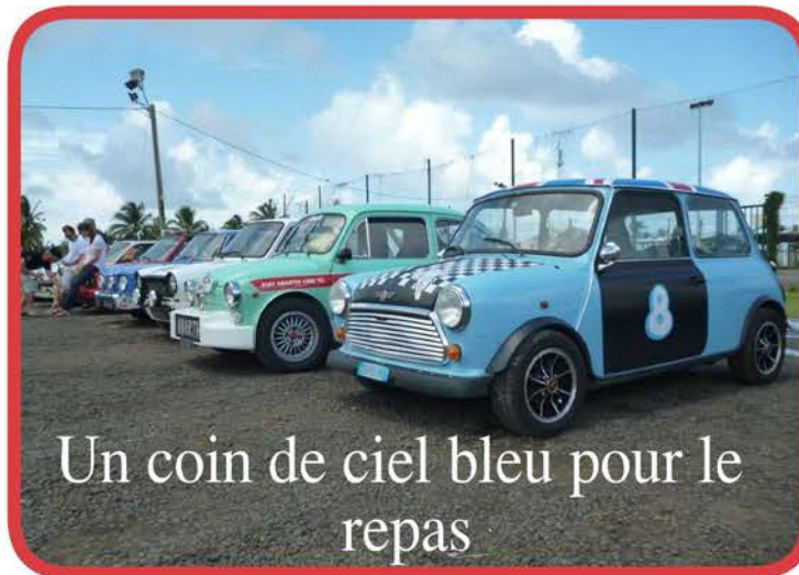
Un coin de ciel bleu pour le repas