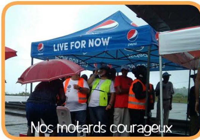
Nos motards courageux