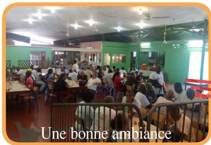
Une bonne ambiance