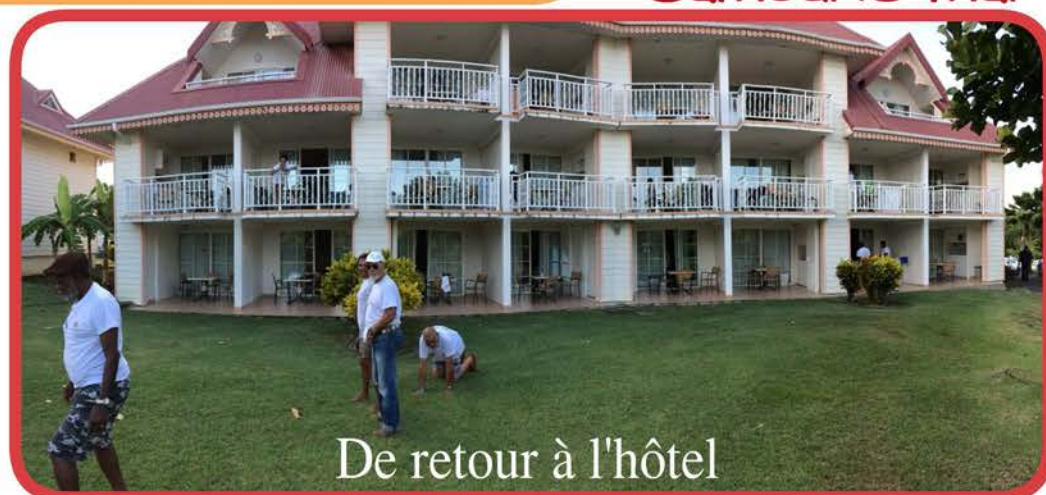
De retour à l'hôtel