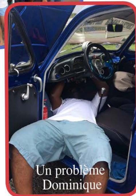
Un problème Dominique