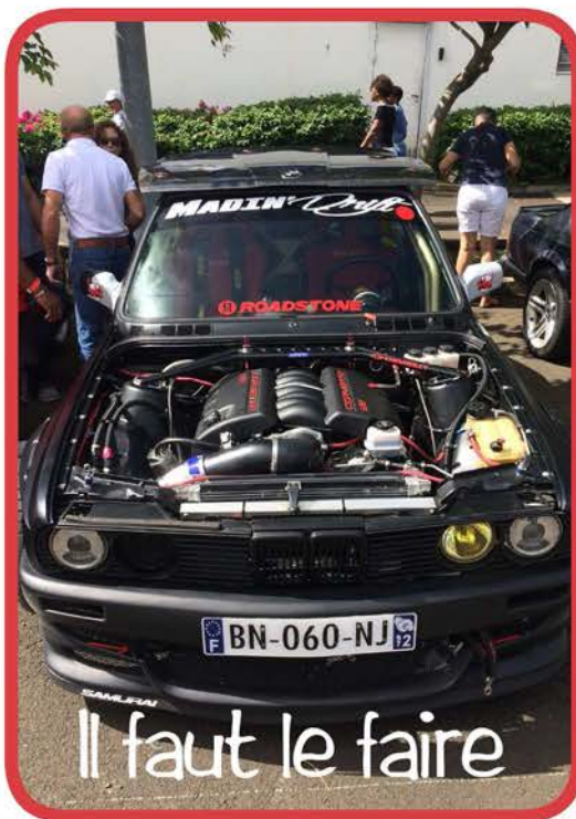
Il faut le faire