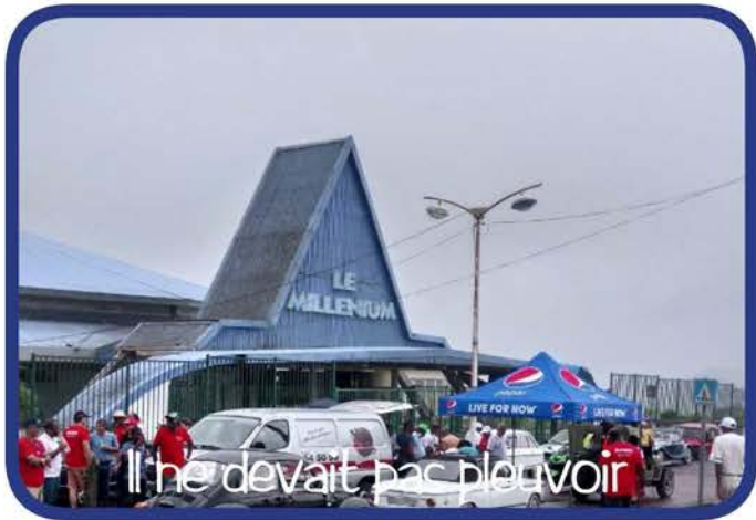
Il ne devait pas pleuvoir