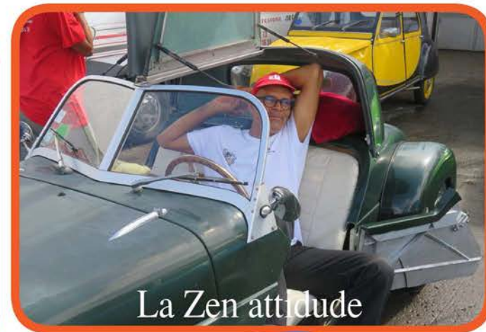
La Zen attitude