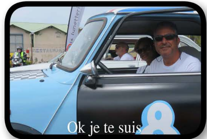
Ok je te suis