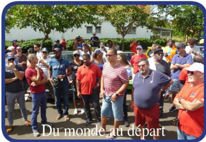
Du monde au départ