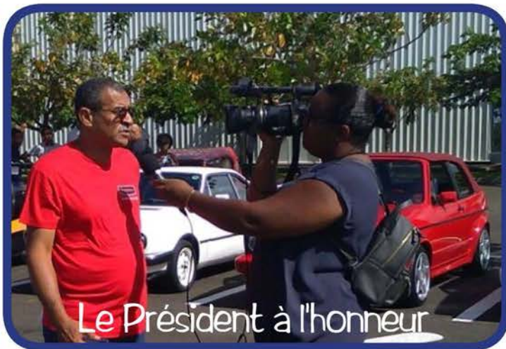
Le Président à l'honneur