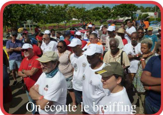
On écoute le breiffing