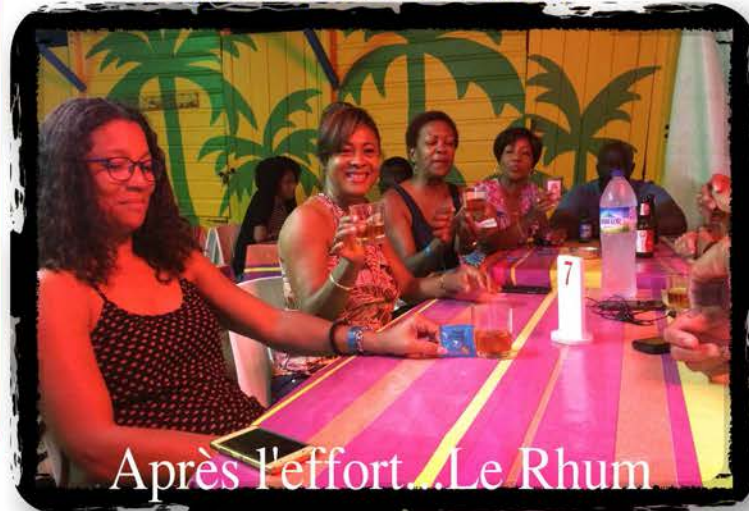
Après l'effort... Le Rhum