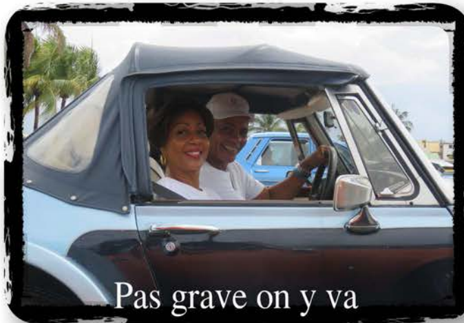
Pas grave on y va