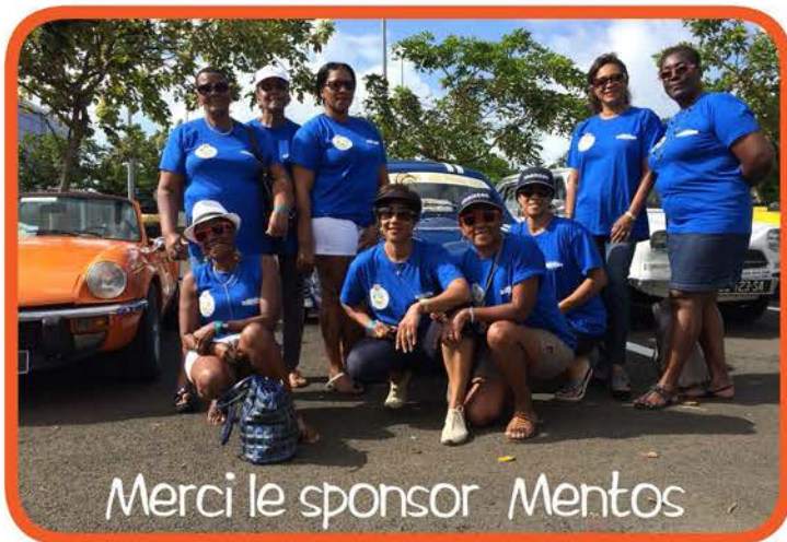
Merci le sponsor Mentos