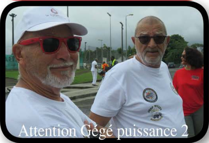
Attention Gégé puissance 2