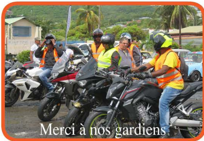
Merci à nos gardiens