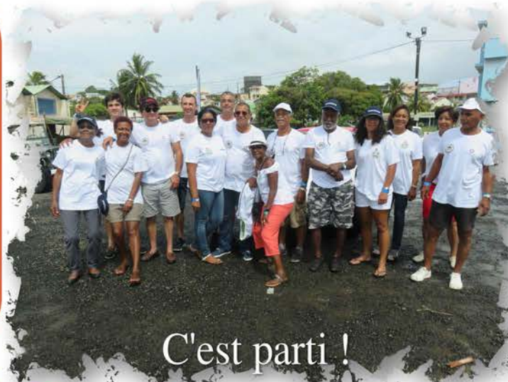
C'est parti !