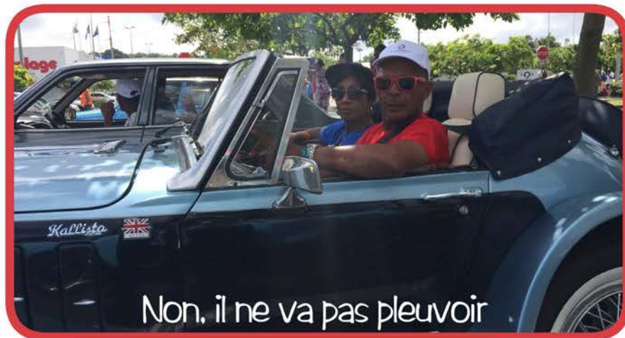
Non, il ne va pas pleuvoir