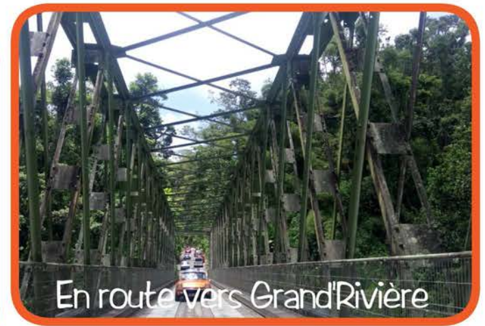
En route vers Grand'Rivière