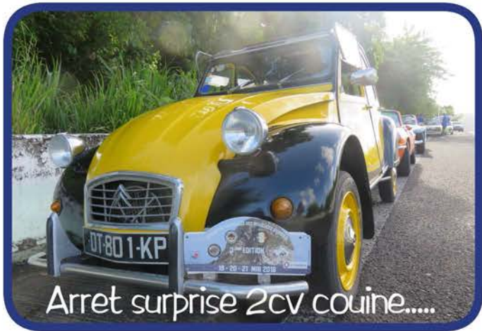
Arret surprise 2cv couine.....