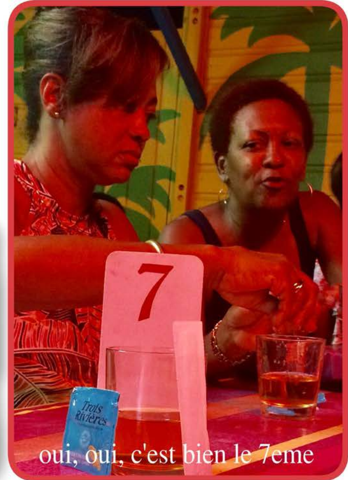
oui, oui, c'est bien le 7eme