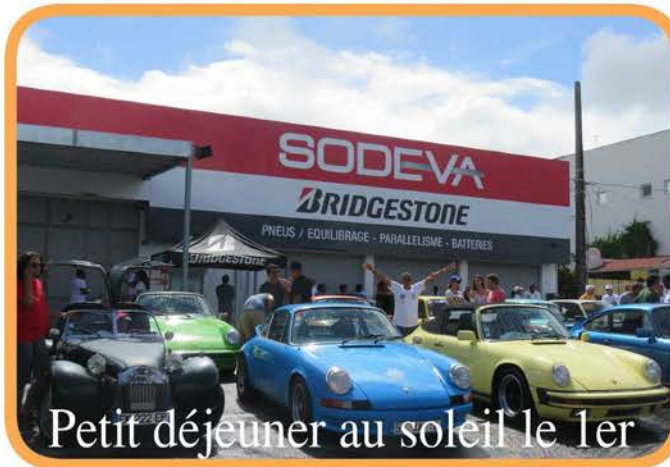
Petit déjeuner au soleil le 1er