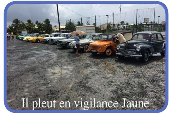
Il pleut en vigilance Jaune