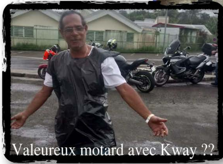
Valeureux motard avec Kway ??