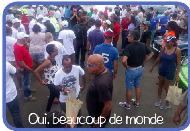
Oui, beaucoup de monde