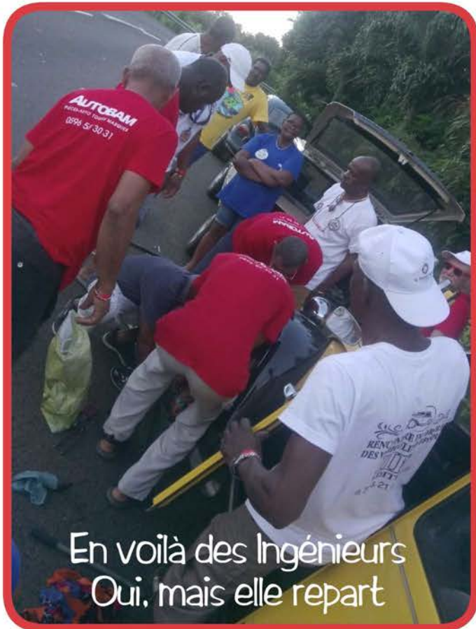
En voilà des Ingénieurs Oui, mais elle repart